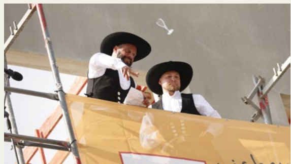
Poliere nach dem Richtspruch

Drum heb ich das Glas und trink ohne Hast auf den Bauherrn, den Bau und jeden Gast! Das Glas zerspring – der Spruch ist aus, hoch lebe dieses neue Haus!“