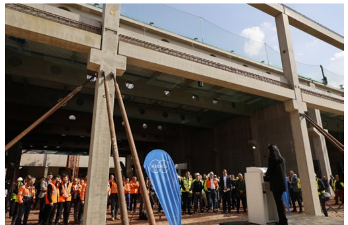
Arungalai Anbarasu vor den Richtfestbesucherinnen und -besuchern