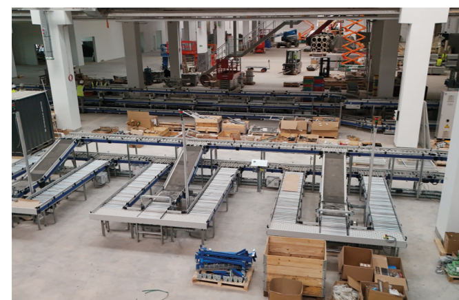
Beginn Montage der Tabakinfrastruktur und Logistik

In Hamburg entsteht eine Fabrik mit einer Fassade, glänzend und schick. Glänzendes Alublech steht für Körper-Hightech. Ein Schmuckstück, für jeden ein Glück!