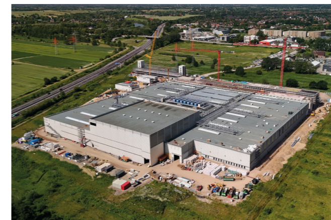
Baufortschritt Stand 24.06.2026