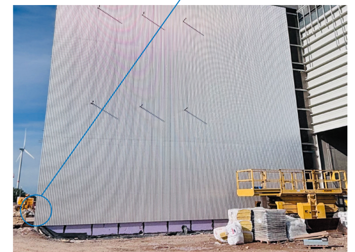
Beginn der Fassadenmontage