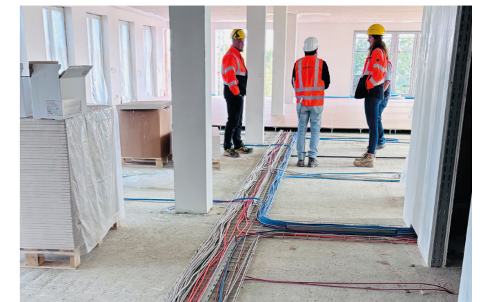
Installation der Kabelinfrastruktur im Verwaltungsgebäude