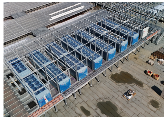
Wärmepumpen auf dem Dach

Eines steht vollkommen außer Frage: Diese für uns so wichtigen Komponenten für den späteren Betrieb des Körper-Neubaus kommen natürlich aus unseren eigenen Werken in Treviso, Pécs und Bergedorf!