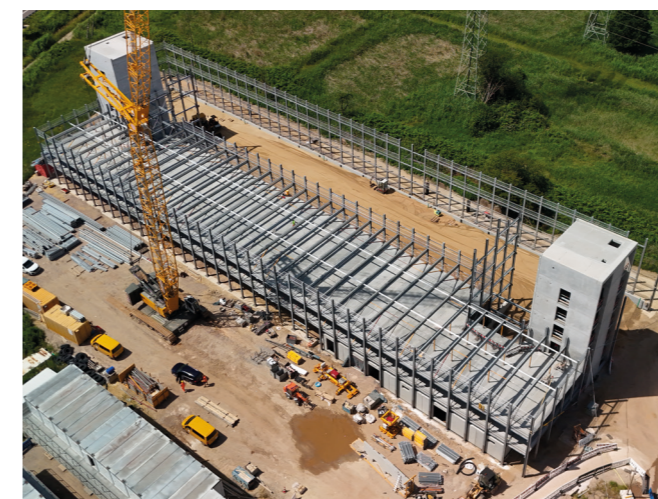
Parkhaus in Stahlskelettbauweise

Das Parkhaus wird mit einer elektronischen Ein- und Ausfahrkontrolle versehen und steht ausschließlich den Mitarbeiterinnen und Mitarbeitern von Körper sowie Gästen des Unternehmens zur Verfügung.