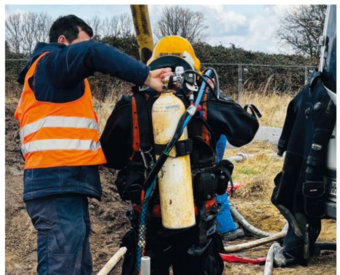
Taucher macht sich bereit